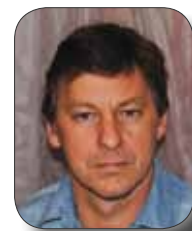
Bronislav Havlín starosta města