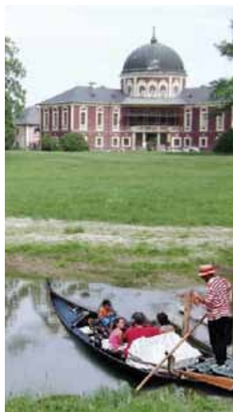
Gondola – Snad bude plavba bezpečná

Pak jsem se probudil. Ještě jsem toho asi hodně zaspal, protože se mi zdálo taky o obnovené zámecké konírně, o vodopádu, který se při prohlídkách spouští nad jeskyni (tzv. grottu) za přírodním kinem, o ovčíně a ještě o mnohých dalších zážitcích z veltruského par-