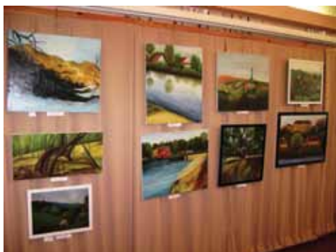
Autor vypráví příběhy fotografií

V květnu až do 6. června probíhala výstava obrazů VĚRY PODZIMKOVÉ. Její obrazy jsou překvapivé nejen svou poetickou náladou, ale i současně robustní stavbou zobrazených motivů. Malířka našla Veltrusy jako nový domov, zatím ale převládají náměty z jižních a severních Čech, odkud pochází a kde působila léta jako učitelka. Současně byly vystaveny zajímavé fotografické struktury různých přírodních i umělých objektů –