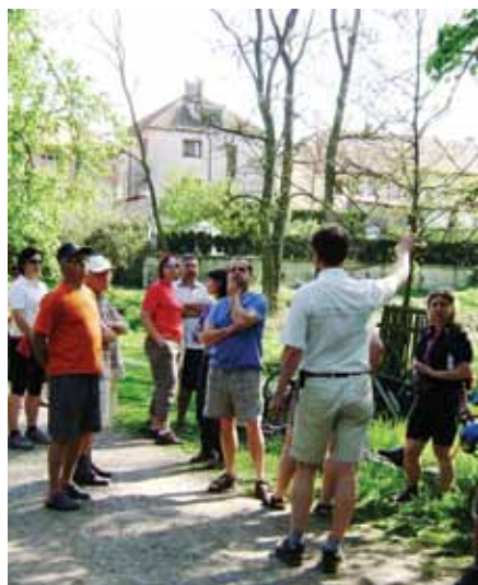
Obora se asi rozšíří

Měl jsem sen. Přijel jsem po delší době do Veltrus a navštívil zámecký park. Začínal květen, snad nejhezčí měsíc roku, a do parku přicházely od nedalekého parkoviště skupiny návštěvníků. Vypil jsem espresso v kavárně hned vedle brány, prohlédl si zajímavosti v informačním středisku, ale netušil jsem, co na mne čeká. Řadu let jsem zde nebyl. Za známou vstupní bránou do parku musím projít po pěkné mlatové cestě. Na chvíli z ní mohu sejít a vstoupit do přístupné části obory, kde prý někdy z bezpečné vzdálenosti může návštěvníka pozorovat stádečko daňků. Pak ale už bez problémů vstoupím do volného areálu parku. Trochu musím přidat do kroku, protože za pár minut vypluje od přístaviště u „Špíglu“ projíždková gondola, která s desítkou pasažérů popluje Mlýnským potokem až někam k Egyptskému kabinetu. Řídí ji a poutavě o historii parku vyprávějí studenti, kteří se právě vzdělávají