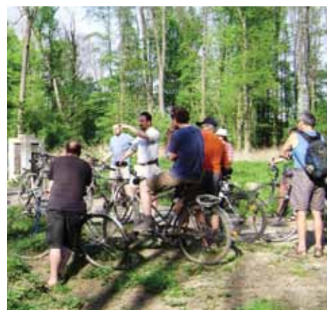
U obnoveného můstku

Všechno vzniklo následkem zážitku z odpoledne letošního 1. května, kdy se už po třetí konalo setkání občanů, kteří se chtějí dozvědět, co se ve veltruském zámku a parku děje. Účastníci se sešli v Rudolfově sále na zámku,