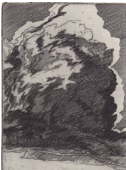
Holan: Dokumenty od básníka Vladimíra Holana – Mrak