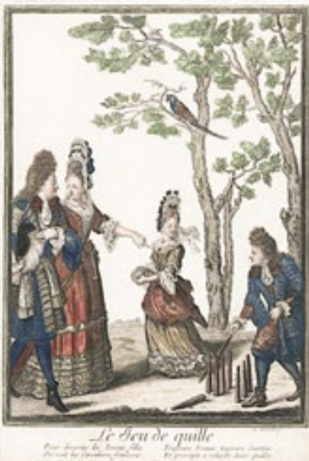
Vysoká šlechta sportuje – grafiky, Nicolas Arnoult (1650–1722)

V oblíbenosti byl tenis, který se v té době hrál nejčastěji jako „jeu de paume“, hra dlaní proti zdi, a „real tennis“ na speciálních