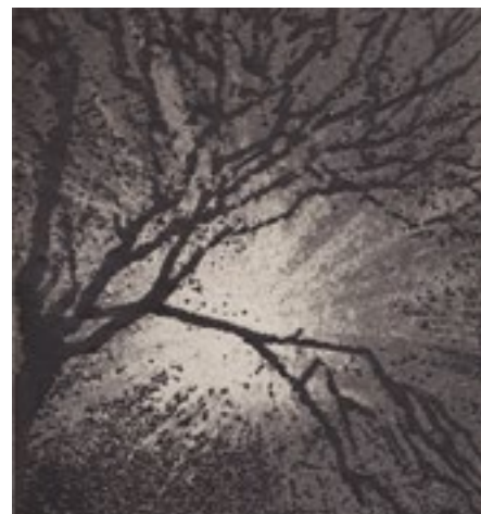
JE: Ilustrace v knize Jana Eyrová Charlotty Brontëové – Strom