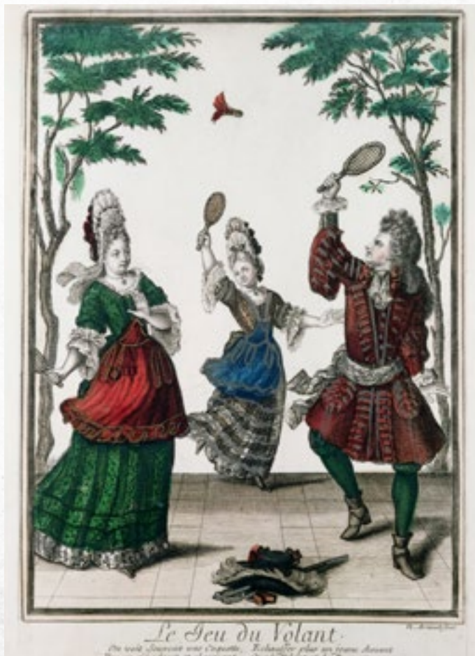
Vysoká šlechta sportuje – grafiky, Nicolas Arnoult (1650–1722) červen 2024

z nejoblíbenějších aktivit dostihy. S narůstající popularitou sázení na vítěze a zájmem o rychlost se do těchto závodů začal vkládat měřitelný prvek – čas. Základní charakteristikou moderního sportu se tak stalo měření dosaženého výkonu časem. ➔