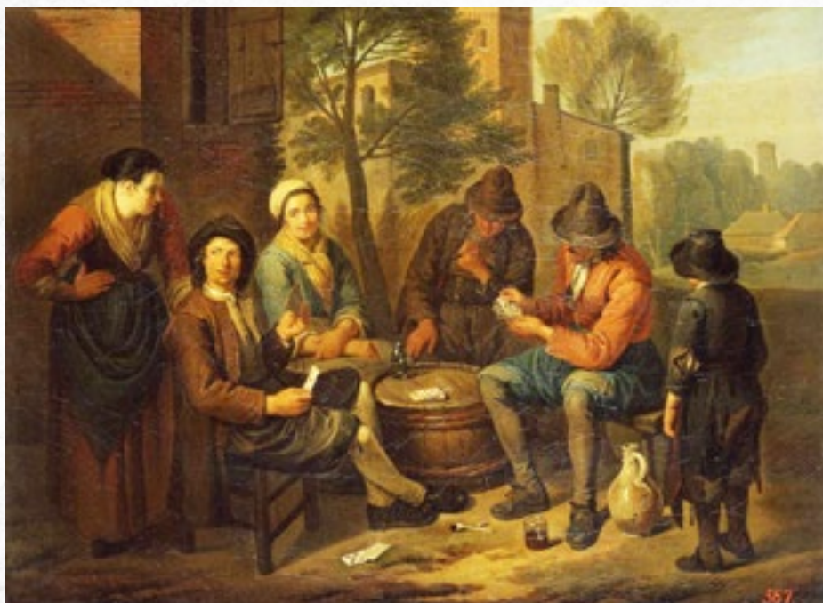
Venkované hrají karty, 1700, Norbert van Bloemen (1670–1745)

Na venkovských slavnostech, které pořádala šlechta, byly sportovní hry a závody častou součástí. Šlechta zajišťovala organizaci a financování těchto slavností, vítězové sportovních soutěží byli odměňováni a stávali se reprezentanty svého panství v soutěžích většího územního celku. Patronát nad těmito slavnostmi byl pro šlechtu výhodným způsobem sociální kontroly nad volným časem a zároveň umožňoval kapitalistické podnikání v ob-