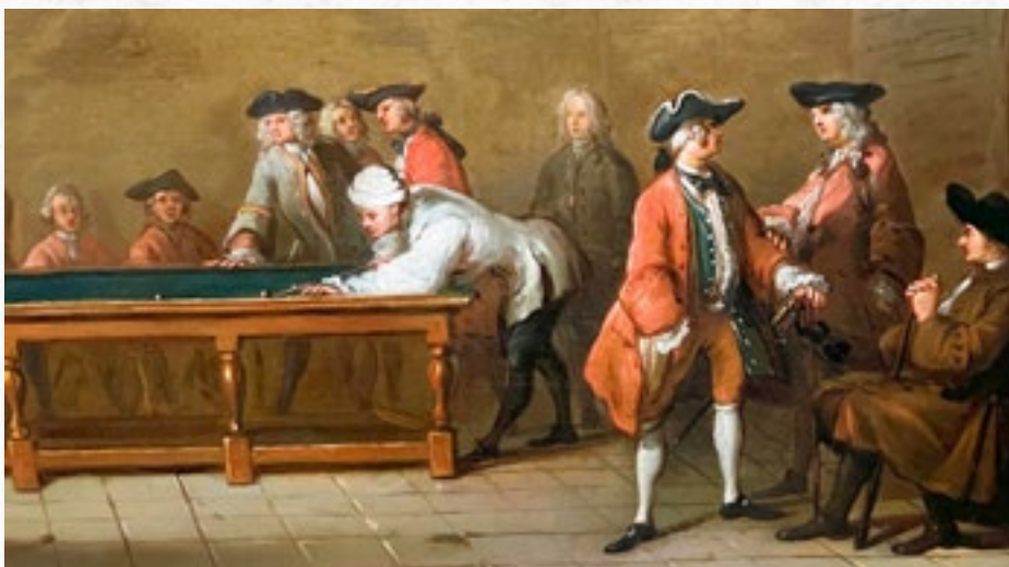
Partie billiard – výřez, kolem 1725, Jean-Baptiste Simeon Chardin (1699–1779)

lasti sázek na sportovní soutěže. To dále napomohlo profesionalizaci sportovců a dalšímu rozvoji závodění.