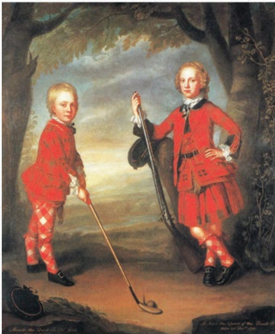
Chlapci MacDonaldové hrají golf, kolem 1750, William Mosman (1700–1771)

Na menší louce poblíž okružní aleje stálo Ptačí bidlo (Vogelstange). Jednalo se o stožár zesílený ve spodní části a s jakousi konstrukcí na vrcholu. Panstvo jej využívalo při střeleckých soutěžích, při nichž museli účastníci projevit smysl pro hru, galantnost a také humor. Strílelo se zde