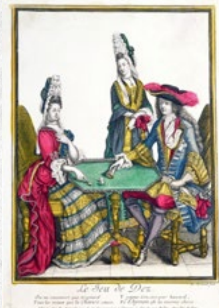
Vysoká šlechta sportuje – grafiky, Nicolas Arnoult (1650–1722)

S dostihy provázané běžecké a chodecké závody prošly rychlou transformací. Během první poloviny 18. století však došlo k jejich oddělení. O tom v roce 1727 napsal do svých Anglických listů samotný Voltaire!