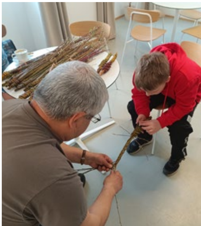
Na předvelikonočním workshopu se uplétá pomlázku učily děti i dospělí