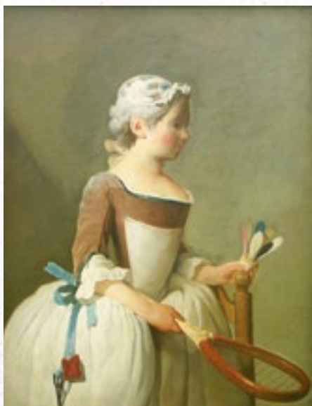
Dívka hrající badminton, kolem 1740, Jean-Baptiste Simeon Chardin (1699–1779)

Mnoho moderních sportů a her vzniklo v pozdním středověku a na začátku novověku. Jak z názvu slova „sport“ vyplývá (z latinského „deportare“, tedy „užívat si“ nebo „odpočívat“), byly prostředkem k relaxaci a odpočinku. Některé z těchto