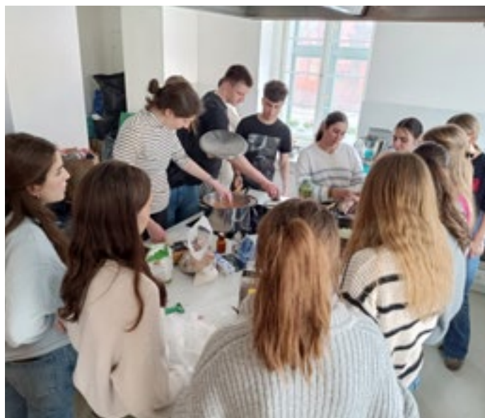
V kuchyni komunitního centra si uvařili i kralupští gymnazisté se svými španělskými kamarády z programu Erasmus