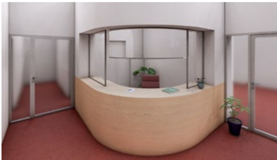
Rekonstrukce vstupu do městského úřadu ve Veltrusích – Vizualizace

Stávající vstupní prostor je tmavý, stísněný a nevhodně členěný. Příčka, která zde aktuálně stojí, zbytečně zmenšuje prostor a brání plynulému pohybu návštěvníků. Nový návrh přinese odstranění této příčky, což povede k výraznému zvětšení prostoru. Tímto krokem získáme více místa pro návštěvníky i pro samotnou podatelnu, která bude vybavena moderním truhlářským řešením s většími úložnými prostory. Zrekonstruovaný prostor bude světlý, vzdušný a přehledný. Použití kvalitních materiálů a moderního designu dodá městskému úřadu důstojnější a reprezentativnější vzhled. Velký důraz klademe také na bezbariérovost, aby byl nový vstup přístupný pro osoby s omezenou pohyblivostí. S rekonstrukcí vstupu proto souvisí