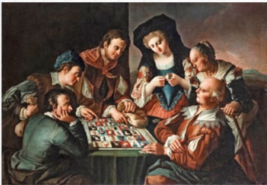
Hra Biribi (mezi lottem a ruletou, hrával i Casanova), Giovanni Domenico Lombardi (1682–1751)

kurtech. Dále se rozvíjel golf (s prvními pravidly z roku 1744), bandy (ruský hokej na dvoře Petra I. Velikého), bowls (takový bowling na trávníku) a curling (první klub vznikl v roce 1716).