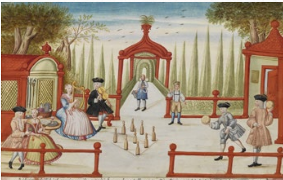
Hudba a bowling, 1736, Johan Franz Hörmannspurger (1710–?)