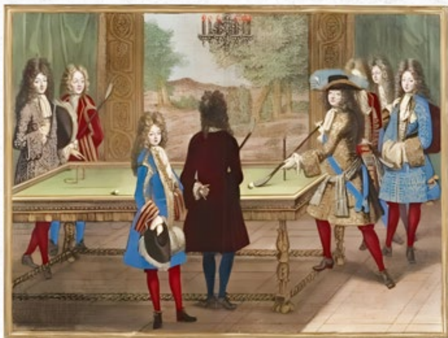
Královská zábava ve Versailles, král Ludvík XIV. hraje kulečnick s Filipem Orleánským, 1698, Antoine Trouvain (1656–1708)

aktivit představovaly čistou zábavu, kterou si obvykle užívali například rolníci a dělnická třída, zejména v neděli, což byl obvykle jediný den, kdy nemuseli pracovat. Tento zvyk často kritizovali církevní představitelé, kteří považovali neděli za den vyhrazený jen Bohu. Situace se začala měnit na konci 16. a začátkem 17. století, kdy několik panovníků začalo oficiálně podporovat vyhrazování prostor, kde se lidé mohli věnovat prvním formám organizovaného sportu a her.